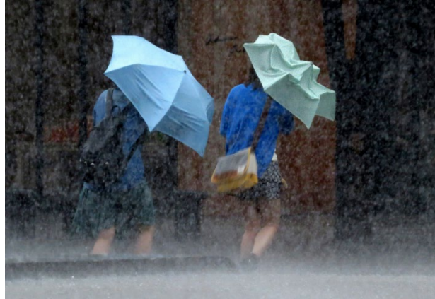
突然の風を伴う強い雨の中、帰宅している写真

問1 この写真で描かれている状況に関して、あなたが課題（問題）だと考える点を1つあげて、説明してください。